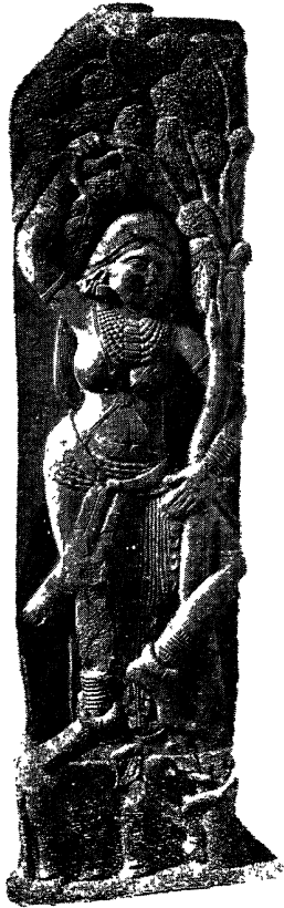
भरहुत—बूल कोका देवता